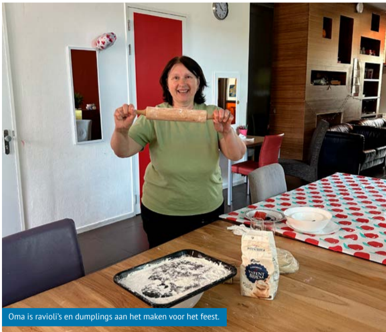
Oma is ravioli's en dumplings aan het maken voor het feest.

Transferium op De Vork is de tijdelijke opvanglocatie voor ongeveer 320 Oekraïense vluchtelingen. In november jl. is de huur met vijf jaar verlengd omdat de situatie in de Oekraïne niet op korte termijn zal verbeteren. Vandaag de dag komen er nog steeds vluchtelingen naar Transferium, veelal mensen die eerst opgevangen waren in gastgezinnen, en mensen die in verband met gezinshereniging naar Nederland komen. Ook het aantal mannen dat eerst in Oekraïne heeft gevochten in het leger en nu een veilig onderkomen zoekt bij familie of vrienden, neemt toe.