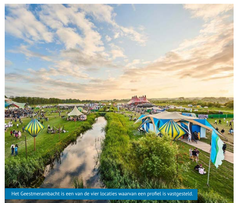
Het Geestmerambacht is een van de vier locaties waarvan een profiel is vastgesteld.

Voor de locatieprofielen per locatie kunt u kijken op onze website: www.dijkenwaard.nl/nieuws