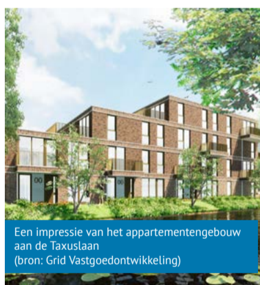
Een impressie van het appartementengebouw aan de Taxuslaan

zienswijzen worden ingediend. Verder stemde de raad in met het gewijzigde bestemmingsplan voor de bouw van een appartementengebouw aan de Taxuslaan 34 in Heerhugowaard. Het bestaande gebouw op deze plek wordt gesloopt. Met de bouw van het nieuwe appartementengebouw komen 28 appartementen beschikbaar. Na vaststelling in de gemeenteraad start een beroepstermijn van zes weken.